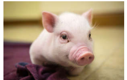
geschrieben von Aaron

Das Schwein hat gerne Schokolade gegessen. Das Schwein heißt Fridolin. Eines Tages ist Fridolin in den Wald abgehauen. Sie war einsam und suchte Freunde. Dann hat sie einen Elefanten getroffen. Dann hat Fridolin den Elefanten gefragt, ob sie Freunde sein könnten. „Nein, du bist viel zu klein“. Dann ist Fridolin durch den Wald gegangen. Dann hat Fridolin eine Ameise getroffen. Dann hat Fridolin die Ameise gefragt, ob sie Freunde sein könnten. Dann hat die Ameise zu Fridolin gesagt „Du bist viel zu groß“. Dann ist Fridolin weiter gegangen. Dann ist Fridolin durch den Wald gelaufen. Und Fridolin wollte wieder Schokolade essen. Dann wollte Fridolin wieder nach Hause. Und Fridolin ist den Weg wieder zurück gegangen. Und dann hat Fridolin ganz viele Tiere gesehen. Und er war ganz müde und seine Augen fielen ihm zu. Und Fridolin ist eingeschlafen. Und Fridolin schlief ganz tief und fest. Als es wieder morgens war, ist Fridolin weiter gegangen. Und dann ist Fridolin angekommen. Er wollte endlich wieder Schokolade essen. Dann hat Fridolin so viel Schokolade gegessen, wie er konnte.